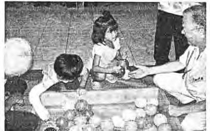
アスタセンターコートでヨーヨー釣りをしている子どもたち