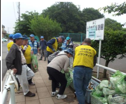
ごみゼロ運動風景