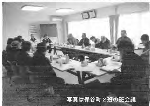
写真は保谷町2班の班会議

この段階で、顧問弁護士でもこのご意見もあり、就業に関する諸規程の整理統合を、さらなる諸規程の整理統合を、さら