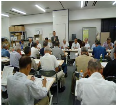
地域班長会議の会場風景