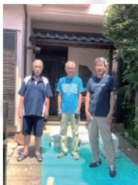
配布者が受け取り