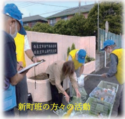
新町班の方々の活動

西東京市高齢者クラブ連合会主催の「統一美化キャンペーン」(ごみゼロ運動)が9月28日(土)に行われました。この運動は、公共の場所に落ちているゴミを拾い、市を挙げてきれいな街づくりを目的として実施されています。当会員の皆様も自宅から、25ヶ所の集積所までの道路に落ちていたゴミやタバコのポイ捨て等様々ですが、年2回、私達の大事な地域の美化に貢献してまいりたいと思います。今後とも、ご協力をお願いいたします。尚、ゴミは持参出来なくても班長さん、会員の皆さんとの談笑だけでも結構ですので是非ご参加ください。(地域・ボランティア委員会)