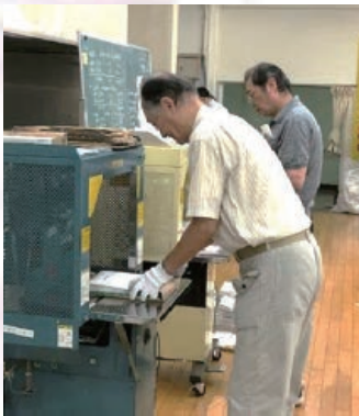
結束機で配布物を梱包