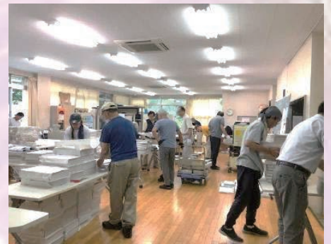
26人が分担して作業開始