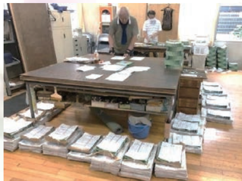
配布者毎の仕分けは手作業